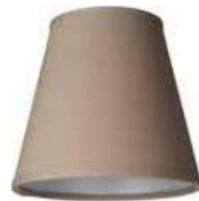
Art.nr S44 Höjd: 15,5 cm Ø: 10 - 17 cm Klotfäste