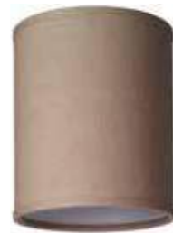
Art.nr S77 Höjd: 18 cm Ø: 15 cm Klotfäste