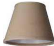
Art.nr S11 Höjd: 11 cm Ø: 8 - 14 cm Klotfäste