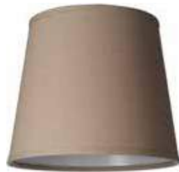
Art.nr S66 Höjd: 17 cm Ø: 15 - 20 cm Ringfäste E27/E14, svängbar