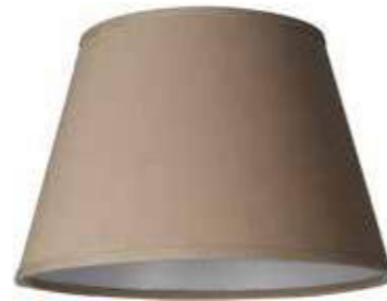
Art.nr S55 Höjd: 17 cm Ø: 16 - 25 cm Ringfäste E27/E14