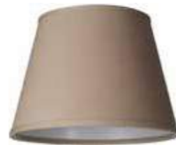
Art.nr S33 Höjd: 14,5 cm Ø: 13 - 20 cm Klotfäste