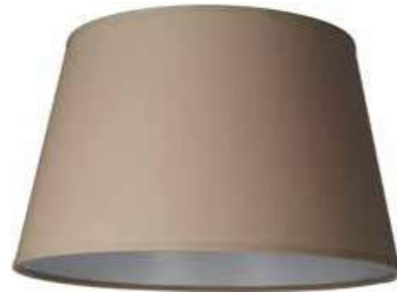
Art.nr S88 Höjd: 24,5 cm Ø: 30 - 40 cm Ringfäste E27, svängbar