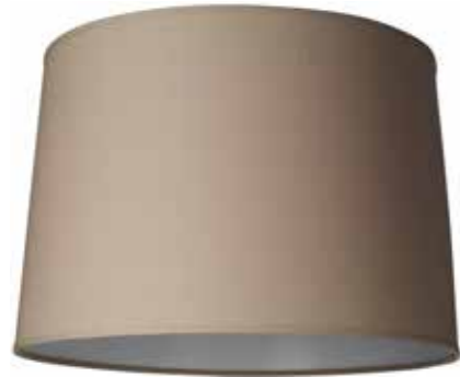
Art.nr S99 Höjd: 30 cm Ø: 40 - 45 cm Ringfäste E27, svängbar